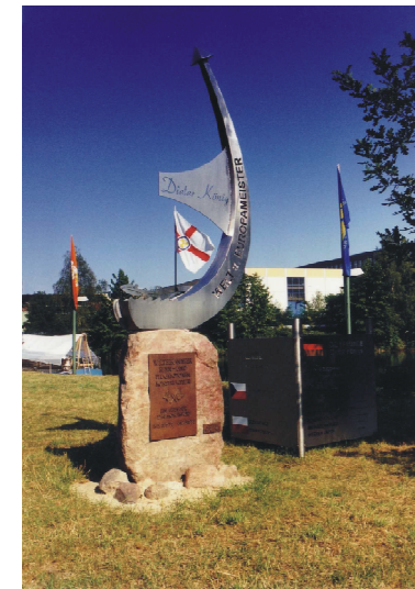
Denkmal für Dieter König Memorial of Dieter König