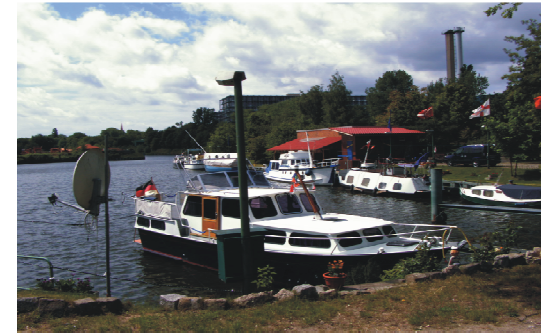
Hafen des MRC Berlin e.V. Harbour of MRC Berlin e.V.