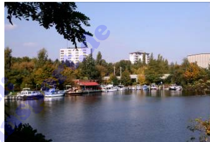
Hafen des MRC Berlin e.V. Harbour of MRC Berlin e.V.