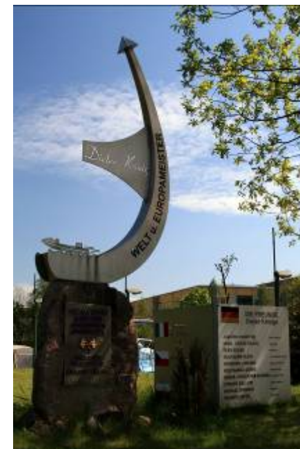
Denkmal für Dieter König Monument to Dieter König